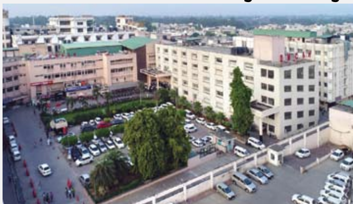
DAYANAND MEDICAL COLLEGE & HOSPITAL