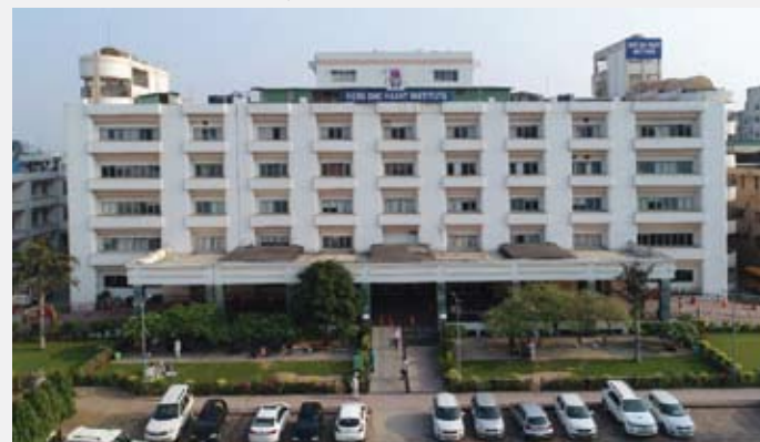
HERO DMC HEART INSTITUTE