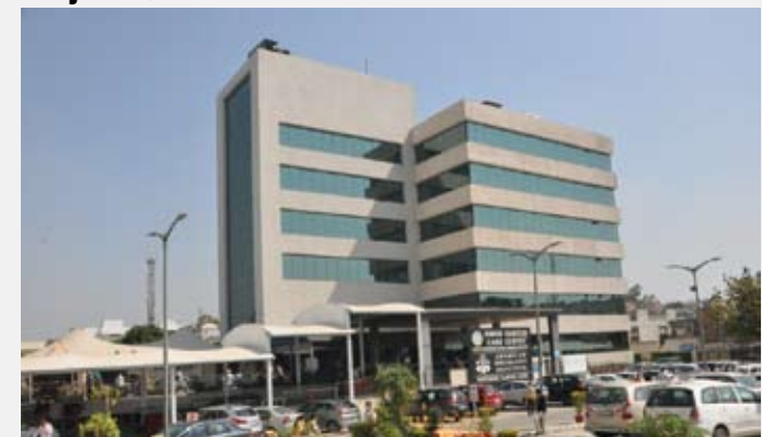
DMCH CANCER CARE CENTRE

It is rightly said "Seeing is Believing" Come and feel the world-class healthcare